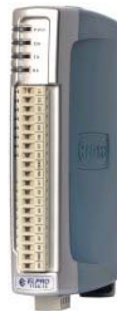
Tableau des Entrées/Sorties I/O en fonction des types de Module 115S