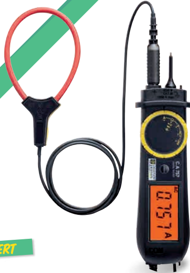
Testeur de tension, de courant & de continuité CA 757