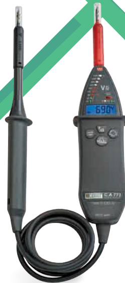
Testeurs DDT/VAT CA 773 CA 773 IP2X