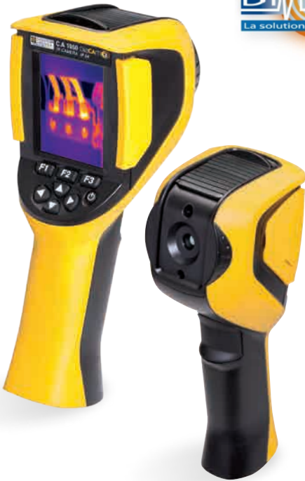
Caméra thermique CA 1950