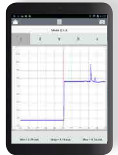
Tablette Android 8" - 16 Go