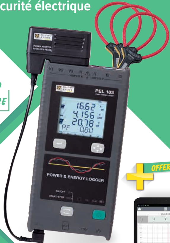
Enregistreur d'énergie PEL103