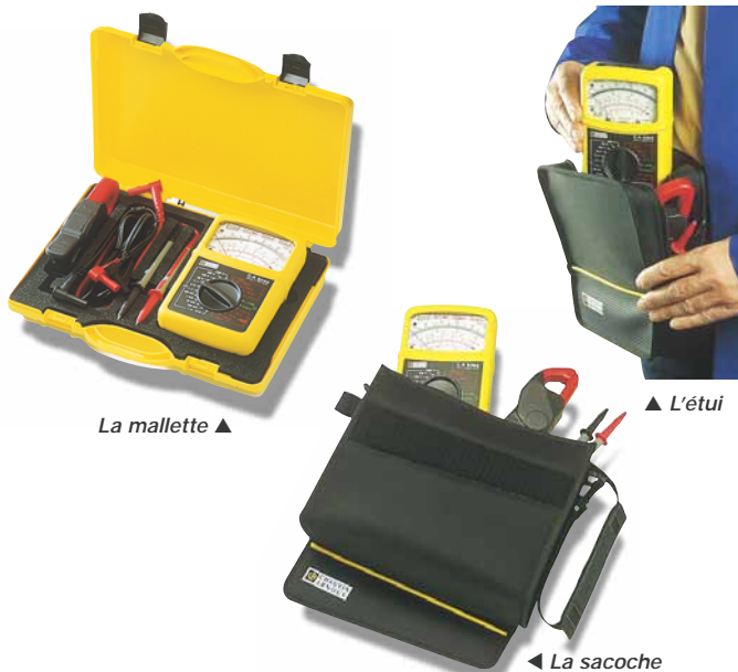
La mallette ▲